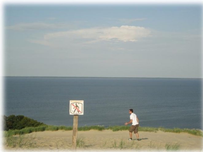
Slika 4: Kuronski rt - ena največjih sipin v Evropi, ki pa jo zob časa in vetra vztrajno znižuje