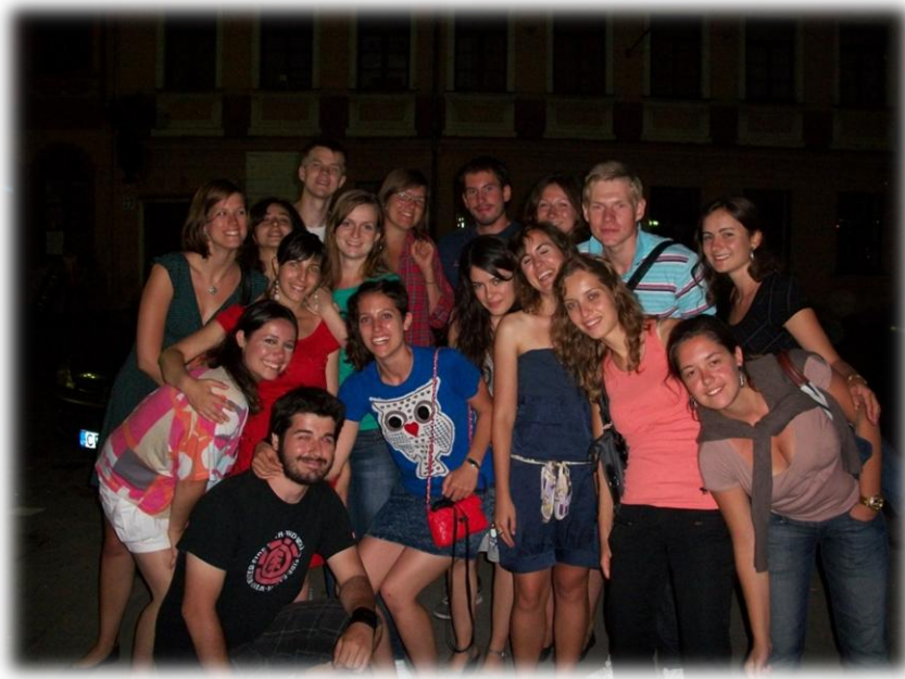
Slika 2: Udeleženci izmenjave

skupaj z njimi preživeli enkratni mesec. Poleg obiskanih mest in izkušenj v bolnišnici mi bodo ostali najbolj v spominu predvsem dobra družba in zanimivi ljudje.