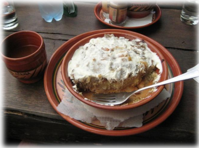
Slika 3: Tradicionalna hrana: krompir, meso, murke - obilno zabeljeno s svinjsko maščobo. Na levi: "Gira"- pijača iz kvasa