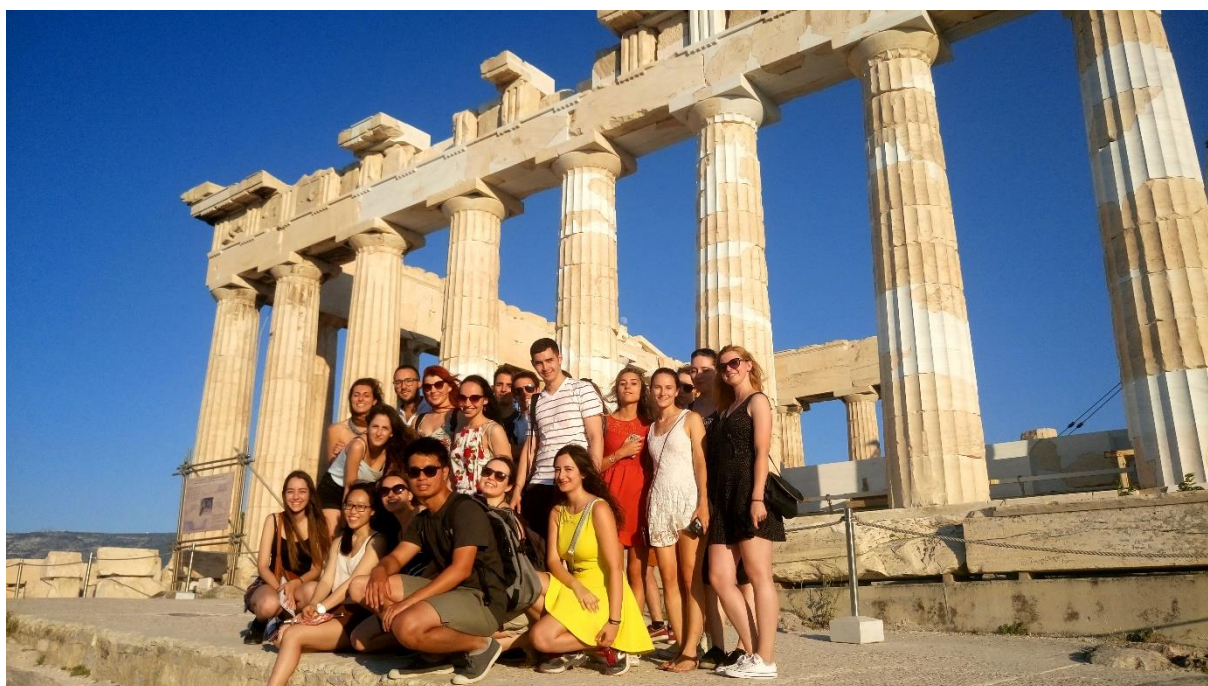
Slika 3: Večji del naše skupine pred veličastnim Partenonom