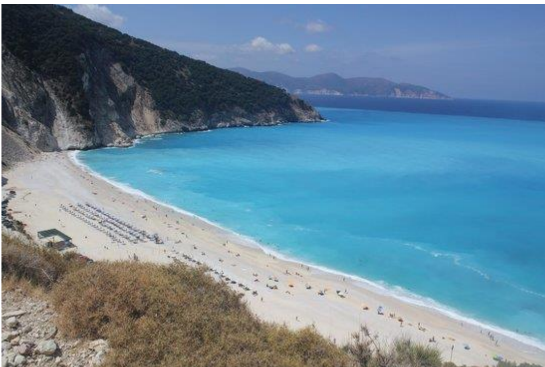
Slika 5: Myrtilos beach; ena izmed najlepših in najbolj znanih plaž na svetu, ki smo jo obiskali na izletu v Kefaloniji