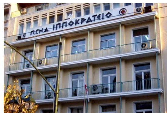
Sliki 1 in 2: Bolnišnica Hippokratio