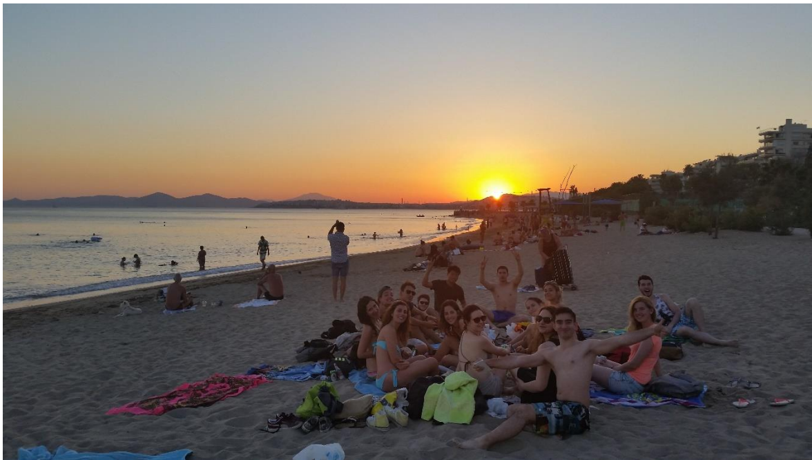
Slika 6: Druženje na plaži :)